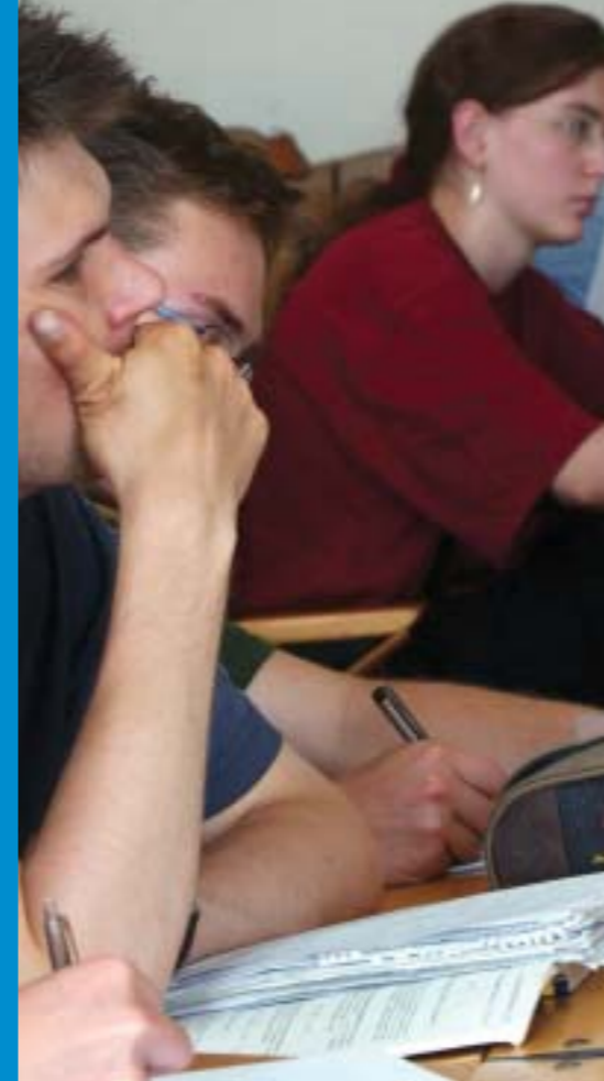
Die Promotion ist die erste Phase der wissenschaftlichen Arbeit

„Promotionsverträge sollen die Rechte und Pflichten der Promovierenden regeln.“