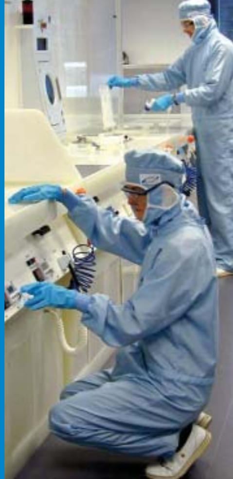
Die Promotion ist nicht die dritte Phase des Studiums

„Die Promotion ist nicht die dritte Phase des Studiums.“