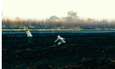
2. Szene (Wolfgang und Anton flüchten)