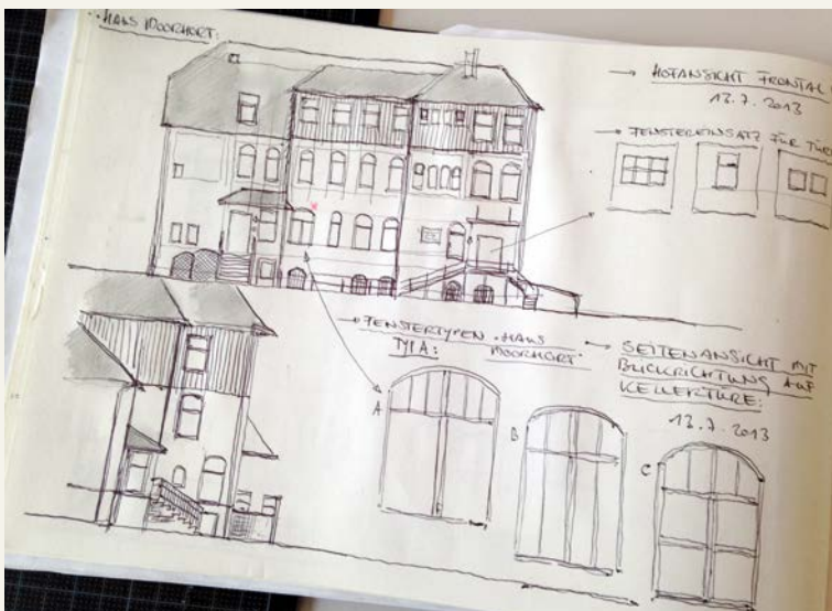
Skizzen zum Setdesign von Christian Strang